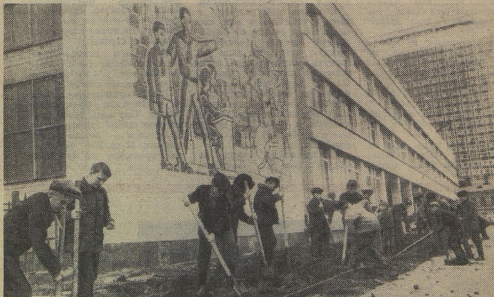
Пионеры из ульяновской школы № 1, где когда-то учился Владимир Ильич Ленин, готовили и весной посадили территорию только что построенной для них новой школы.

Экспедиция продолжается. На следующий день после всесоюзного комсомольского собрания пионеры нашей страны вышли вместе со всеми на коммунистический субботник. И этот день стал для всех праздником, ибо труд этого дня лёг в общию копилку добрых дел, посвящённых знаменательной дате — 100-летию со дня рождения великого Ленина.