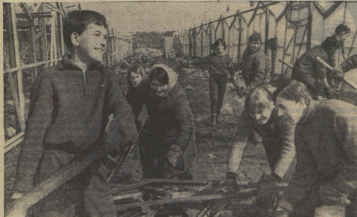
Субботник. Утром школьники из колхоза «Ленинский луч» Московской области расчищали теплицы. В тот же день ребята собрали бумажную мануфактуру на выпуск юбилейного номера районной газеты «Авангард».